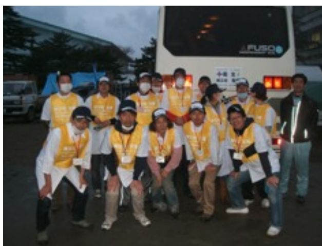
列が途切れやっとなメンバーの写真が取れました