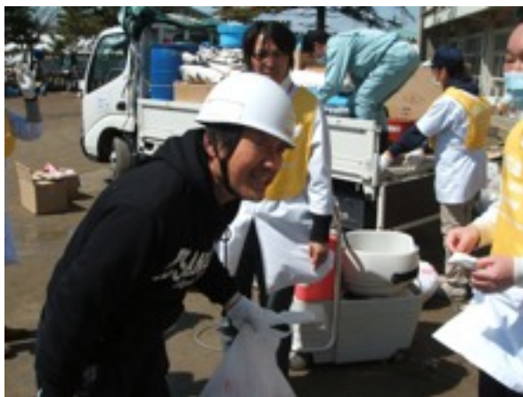
道具を見て喜んでくださった地元の理容店経営者さん

「これでせめて避難所の人たちの髪の毛を切ってあげられる」と涙ながらに喜んでくださっていました。