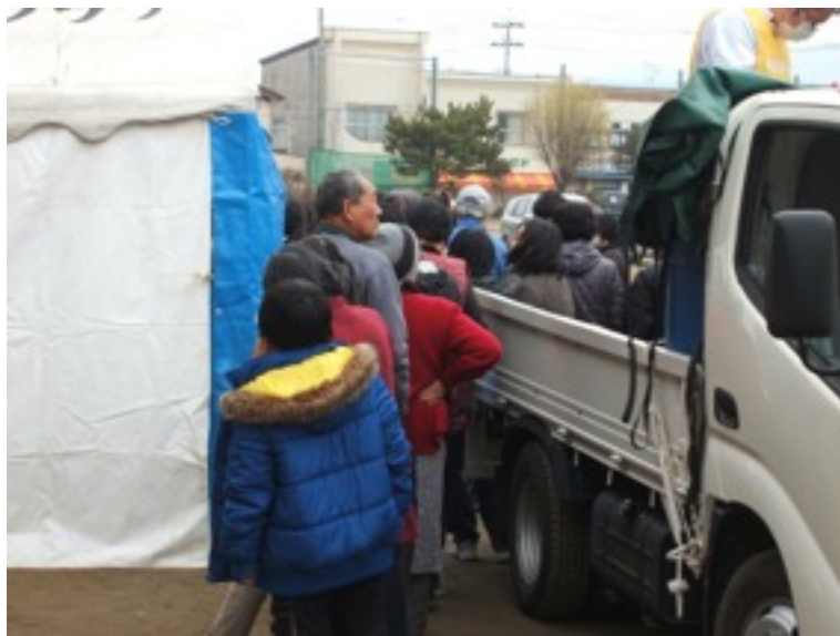
準備中からテント前に長蛇の列