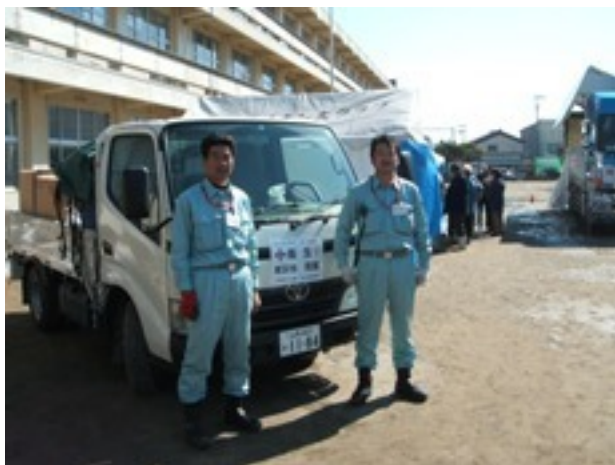
RIBI/LUB本部からのサポートメンバー

そんなことはどちらでもいいですから、「衛生管理」の専門家たる職分として一人でも多くの被災者をケアしてあげてほしいのです。