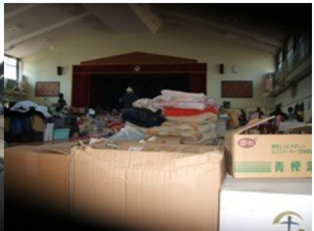
劣悪な環境の避難所