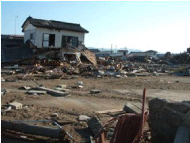
破壊しつくされた街

被災者の皆様が一瞬でも受けた傷が癒えるよう、せっかくお出かけになられた尊い行動が報われるために、私たちが実際に体験してきたことを、お出かけの際の参考にして頂ければとこの資料をまとめました。