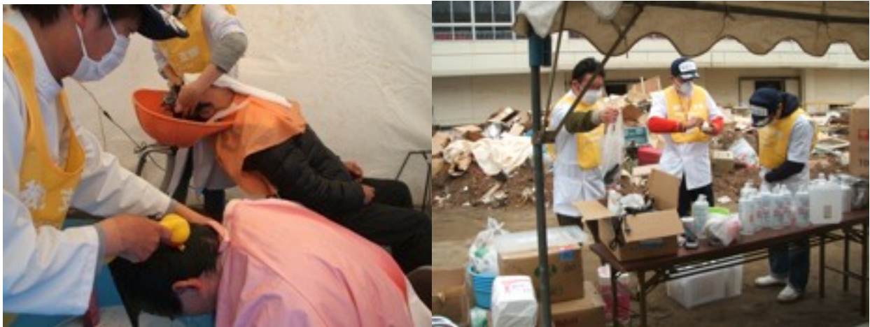
カットよりもまず先に「衛生」

ほとんどの避難所は地元の市町村職員が対応しているわけではなく、各地からの応援職員がなんとか本部を形成しており避難所の対応をしているため、即断即決ができない案件が多いことも避難所の生活環境を向上できない要因に見受けられました。